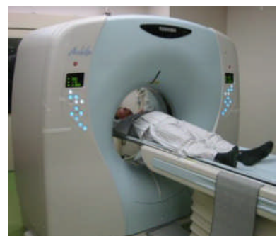
つるぎ町立半田病院 健診室